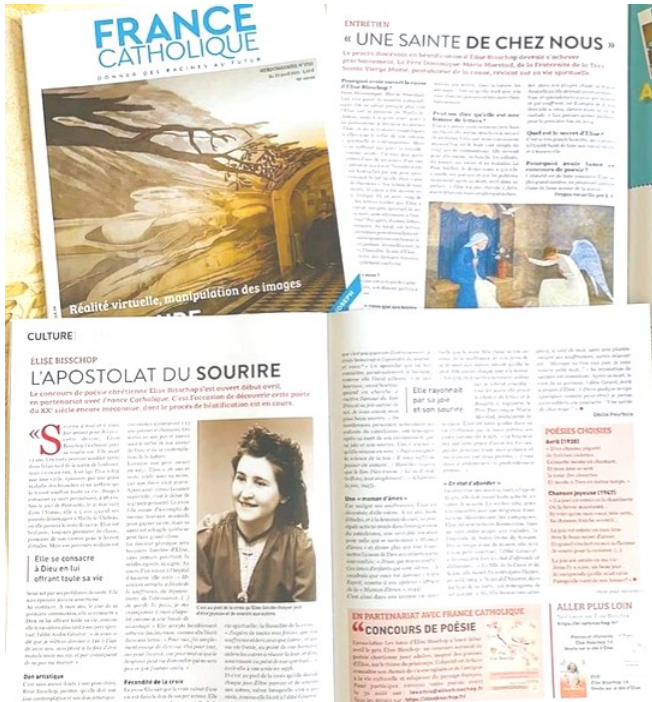
Article et interview sur Élise Bisschop dans France catholique , 23 avril 2021.