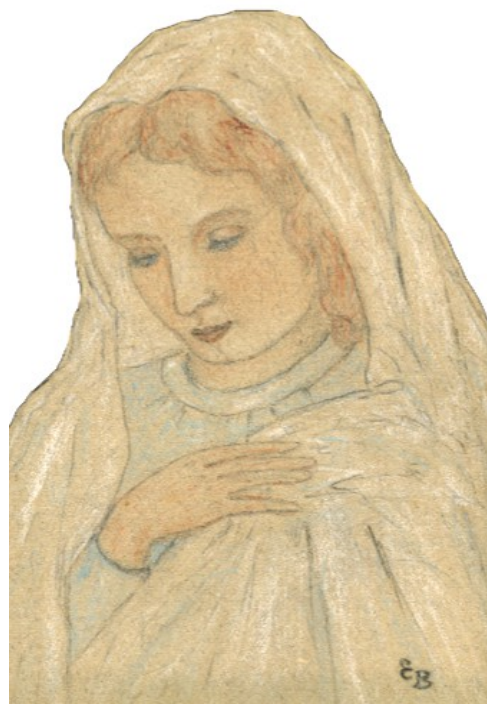
Dessin de la Vierge Marie par Élise Bisschop.