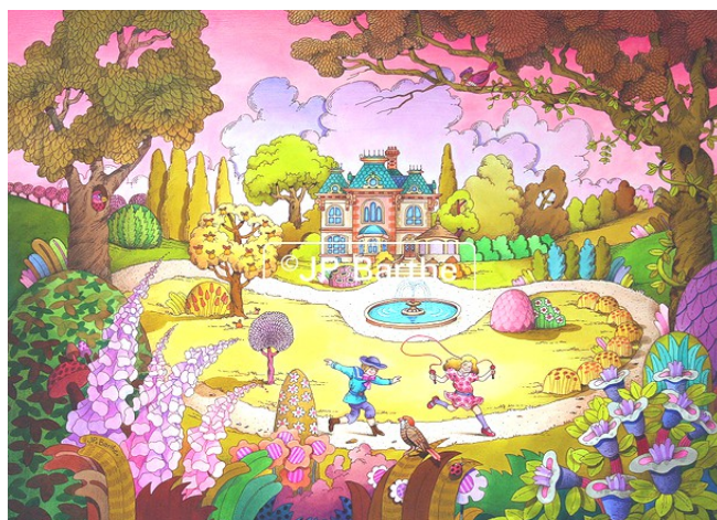
Illustration de Jean-Paul Barthe

Marié et père de deux enfants, Jean-Paul Barthe est également musicien. Il joue de l'orgue (jazz et liturgique) et aime les balades dans le morvan avec son épouse.