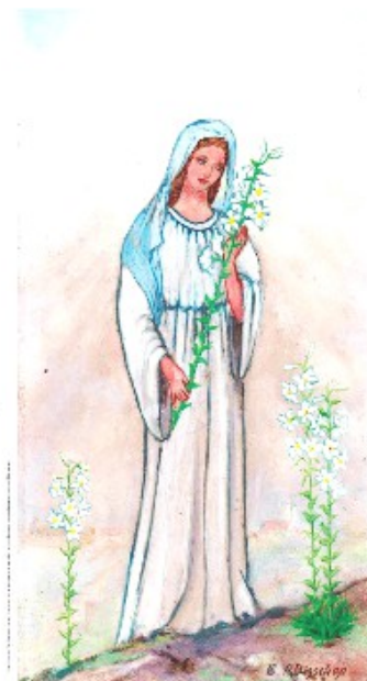
Carte postale de la Vierge Marie, dessin d'Élise Bisschop et de son père René. Maquette de Lionel Silberstein.

Depuis plusieurs semaines, nous proposons de très belles cartes de baptême au format 7,5x13 cm, en 2 modèles avec une citation d'Élise différente. Le support est de très bonne qualité et vous pouvez la personnaliser au verso.