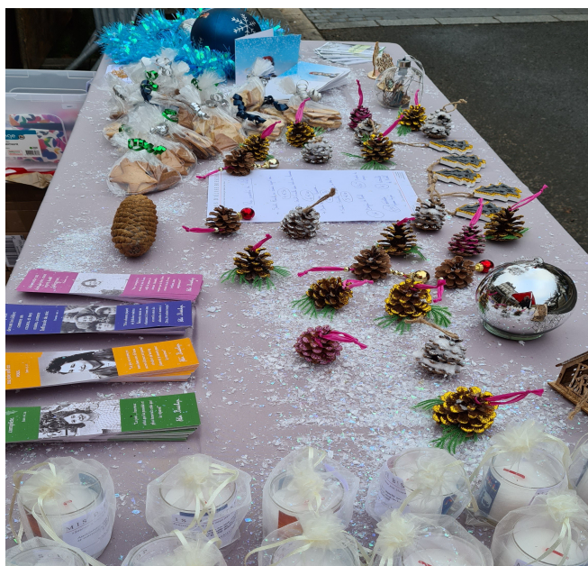
Notre stand sur le marché de Noël à Clamecy.

Nous avons eu l'idée de vendre quelques petites crèches de Noël afin de replacer Jésus au cœur de Noël. Quatre types de crèches lumineuses avaient été commandées spécifiquement pour l'occasion (en bois, boule de sapin, pour enfants). Sur la grande table, les passants pouvaient trouver aussi des biscuits fait maison, des décorations pour embellir la table ou le sapin réalisées à la main par Raphaëlle et sa sœur ! Puis les bougies restantes de Noël dernier.