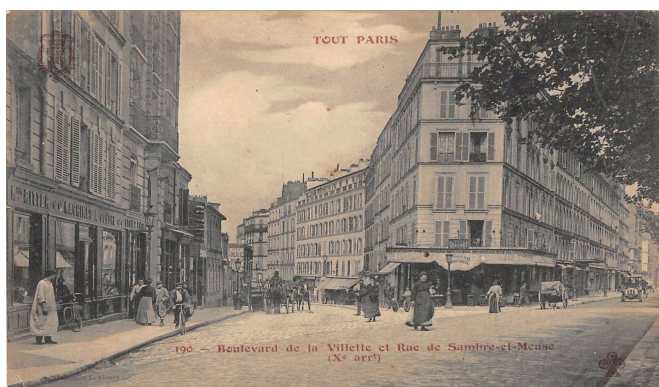
Paris, Boulevard de la Villette et la rue de Sambre-et-Meuse, 1900.

Le 5 juin 1901, Laurent Bisschop et ses associés Henri et Léon Gamichon achetèrent la grande imprimerie parisienne Maison Sédille & Unsworth , fondée en 1789, pour la somme conséquente de 600.000 anciens francs 1 . L'établissement prit le nom de Gamichon frères & Bisschop , son siège social était situé 6 rue de Cléry et les ateliers se trouvaient 4 bis rue Saint-Sauveur (2ème arr.). En 1907, comme l'imprimerie était très prospère, Laurent Bisschop, Henri et Léon Gamichon commandèrent la construction d'un nouveau bâtiment à l'architecte Henri Jandelle-Ramier 2 . Ce bâtiment annexe, construit sur d'anciennes écuries, était situé boulevard de la Villette (19ème arr.).