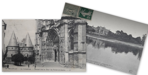
Les deux cartes postales.

Quant à la seconde carte postale, écrite le 23 avril 1924, elle est adressée à la famille Bisschop installée à la Ferme Saint-Hubert à Trucy-sur-Yonne.